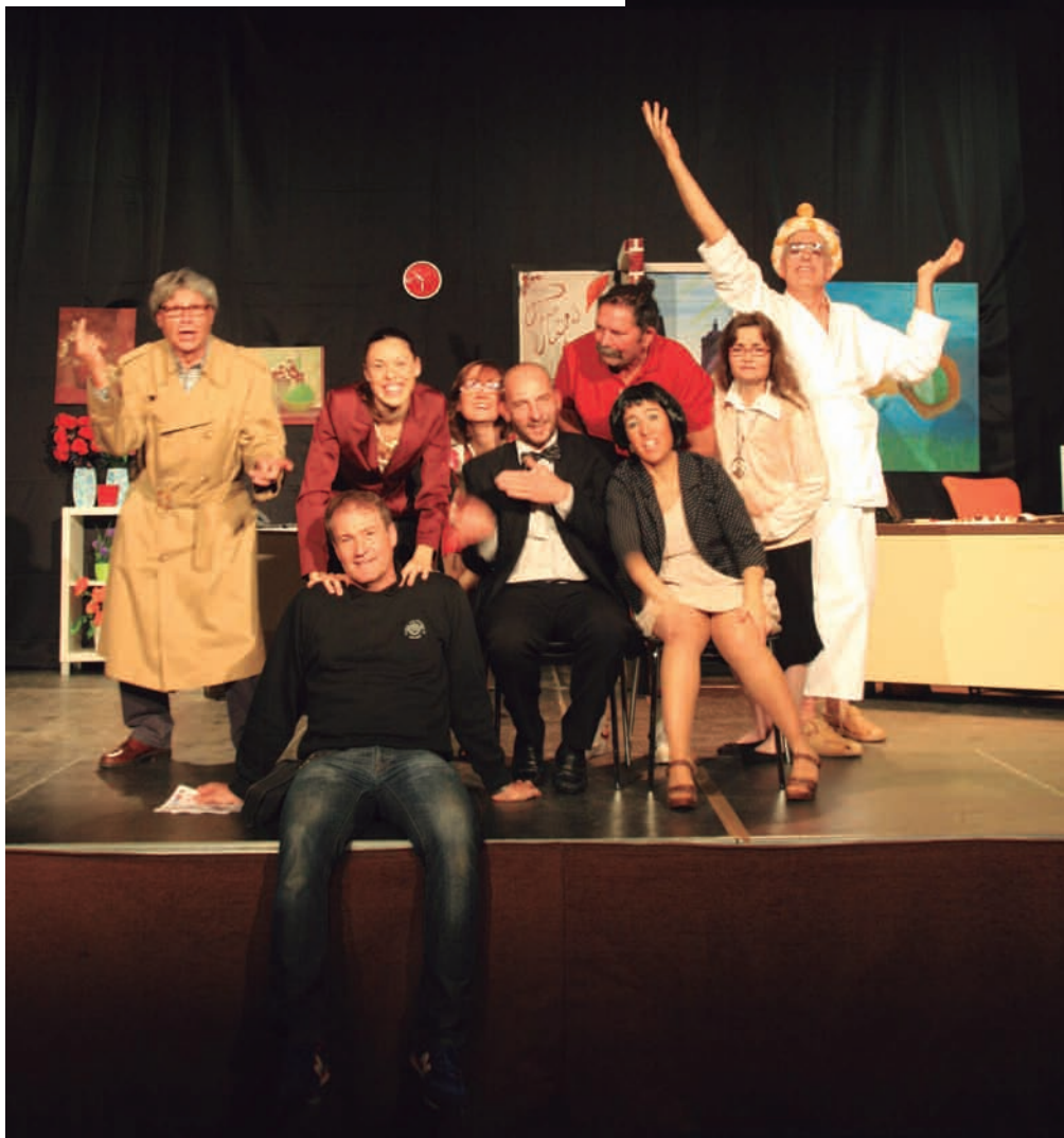
El grup de teatre L'Olla dels Miquelets

Ens referim especialment als actors més joves, els de Medinyà, que han donat un caire més renovador al nostre teatre. Als actors i actrius coneguts i conegudes per la llarga trajectòria que han fet en aquest teatre de Sarrià durant molts anys dels grups de la Cuca de