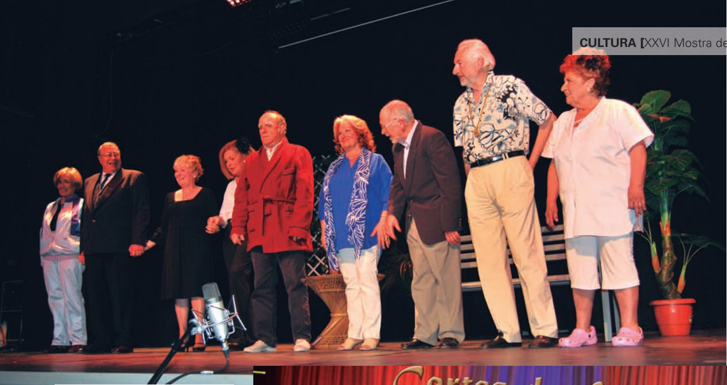
La Retrobada" de Lluís Torner, representada per La Cuca de Llum

llum i l'Olla dels Maiquiets. I a la Cia de Dansa-Teatre Apsarâh, que ha presentat un espectacle teatral i musical molt engrescador que ha donat una nova llum al nostre teatre; la dansa en acció.