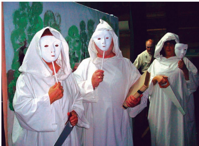
«Metge a garrotades» de Molière, representada per La Cuca de Llum.